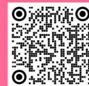
Sexo y cine