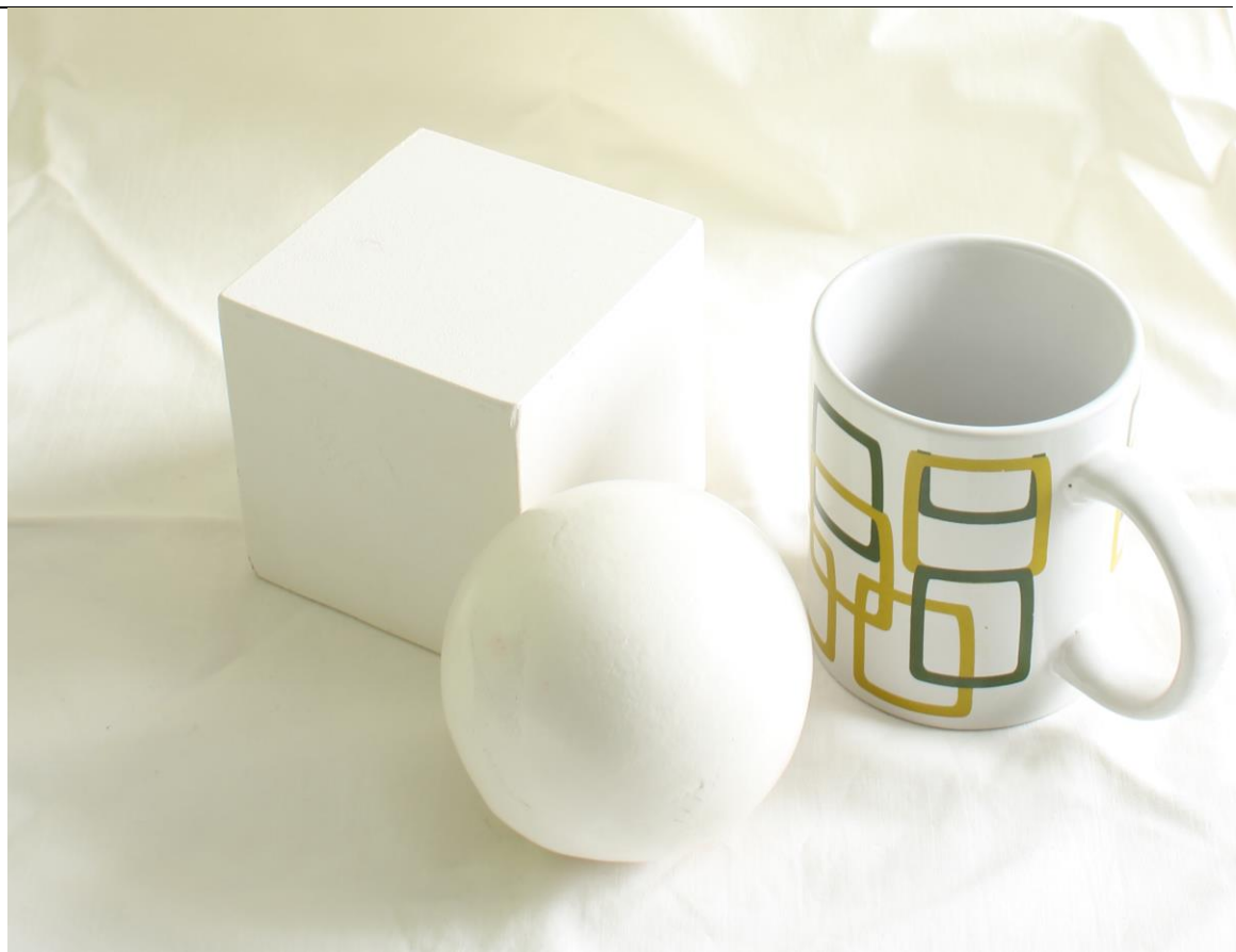
Imagen Nº 2. Modelo examen

Consejería de Educación, Cultura y Deportes