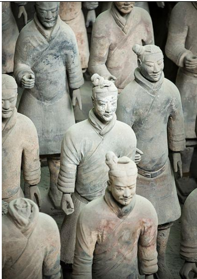
Imagen Nº 2.