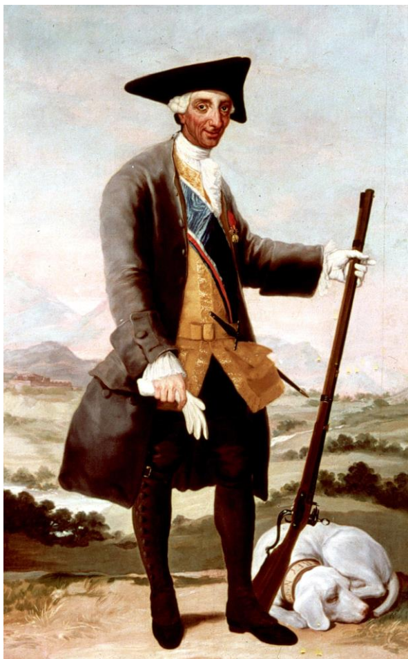
Imagen Nº 1