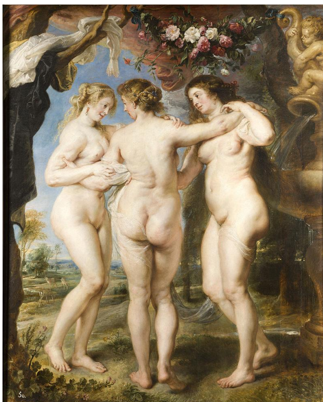
Imagen Nº 1

3) Analice la siguiente obra: (Máx. 2,5 puntos)