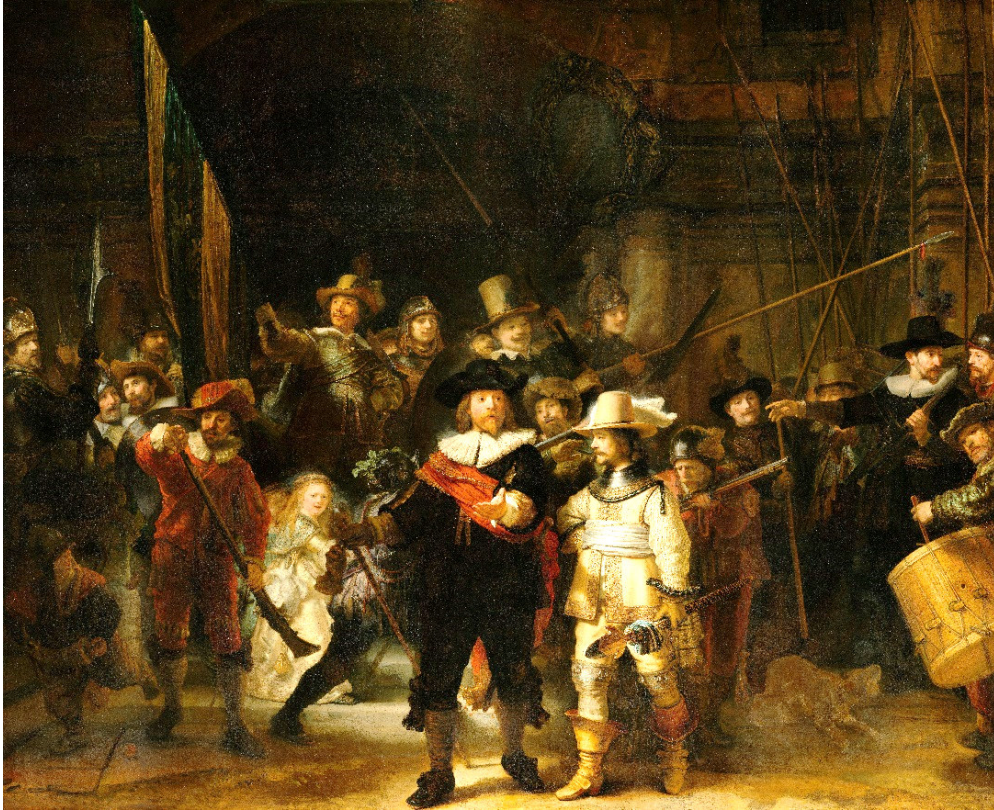
Imagen Nº 2

Fuente: Wikipedia. Este es un archivo de Wikimedia Commons , un depósito de contenido libre hospedado por la Fundación Wikimedia .