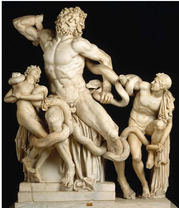
Imagen nº 2