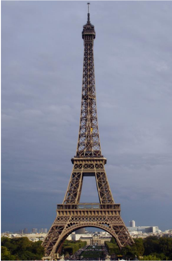
Imagen Nº 2

Fuente: Wikipedia Url: https://es.wikipedia.org/wiki/ Licencia: Creative Commons