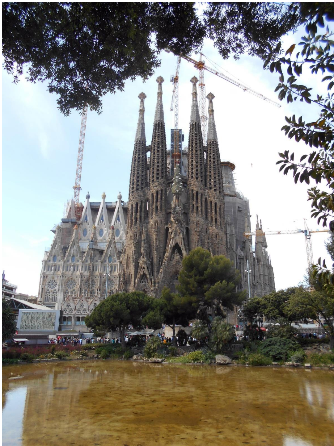
Imagen nº 2