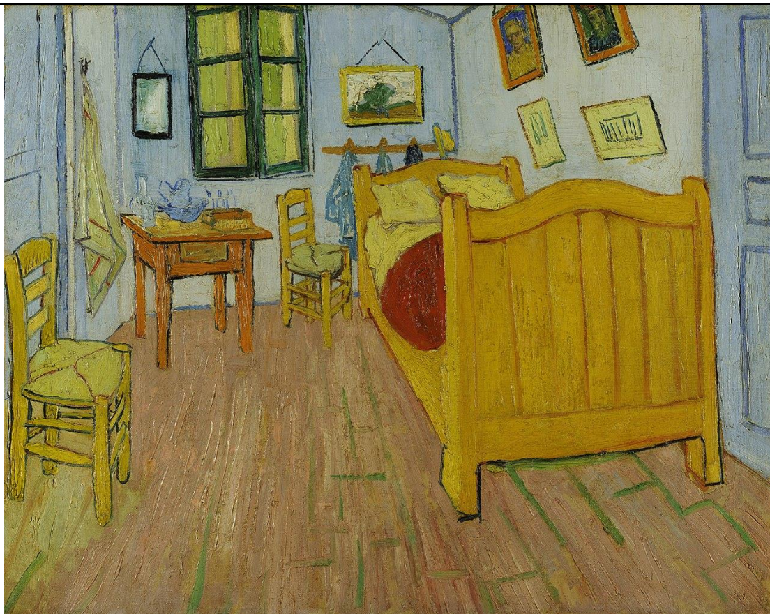
Imagen Nº 2