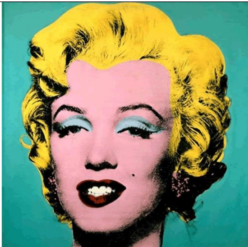
Imagen Nº 3

Consejería de Educación, Cultura y Deportes