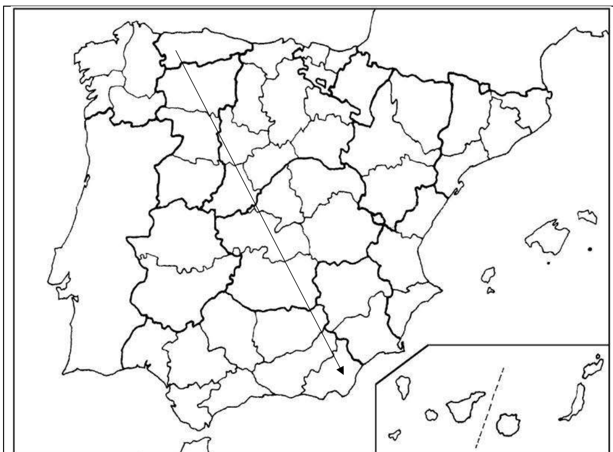
Imagen 2: Mapa de España Url: https://www.pinterest.es/pin/785737466221794165/