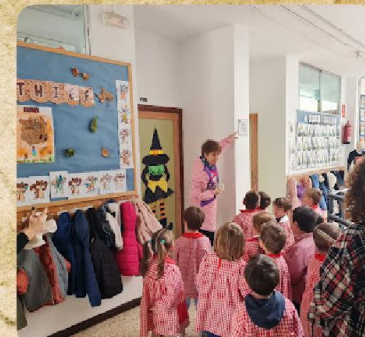
Constitución: nombramos las "calles" de nuestro cole. Creamos azulejos