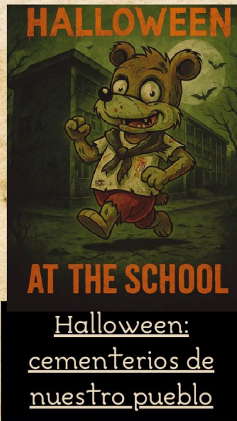
Halloween: cementerios de nuestro pueblo