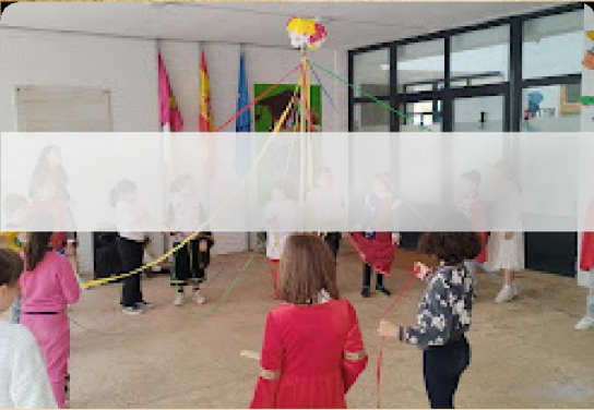
Danza de cintas

Música de temática medieval y preparado en las clases de Música