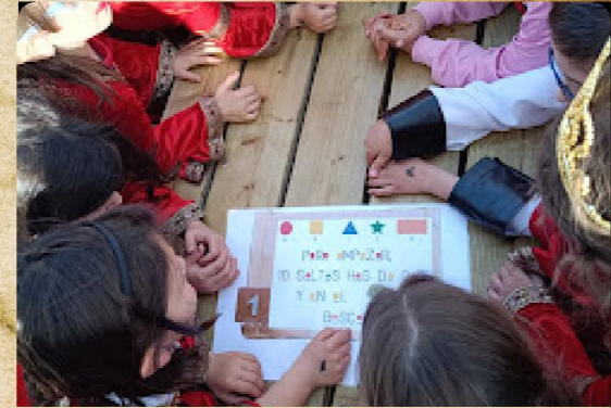
Búsqueda del tesoro

Con diseños medievales y elaborados por alumnado de 6º.