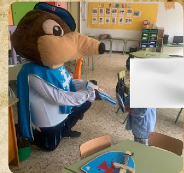
Día del libro: comisión de biblioteca