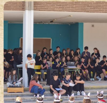
Navidad: villancicos tradicionales