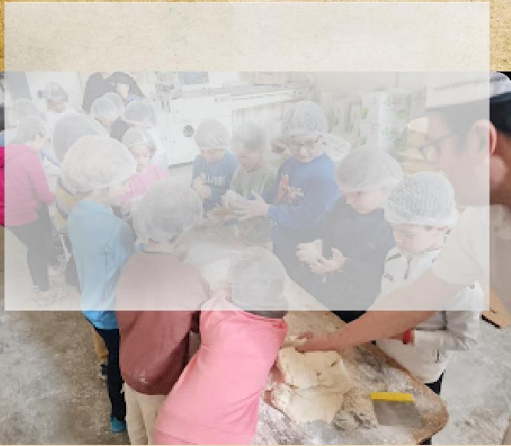
Elaboración de pan

Visita a panadería de la localidad para elaborar pan.