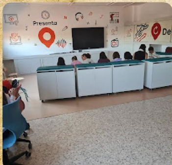
8 marzo: mujeres destacadas de la localidad