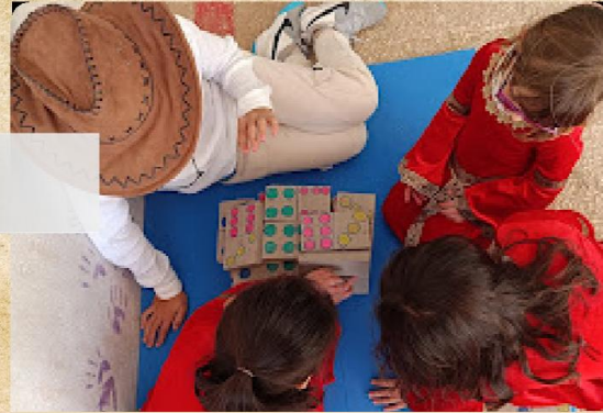
Juegos de mesa

Música de temática medieval y preparado en las clases de Música