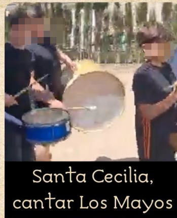
Santa Cecilia, cantar Los Mayos