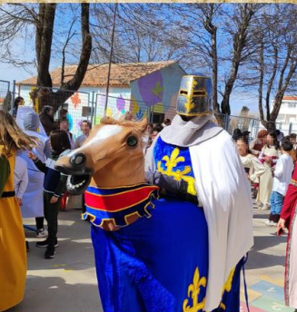
carnaval: desfile temático